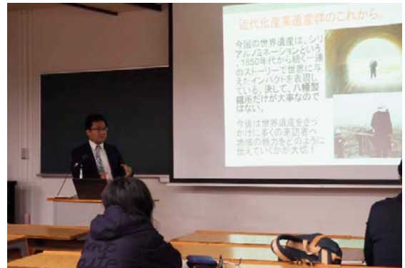
記念講演会の様子