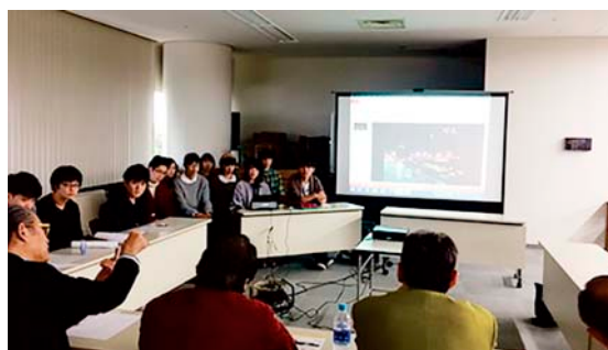
写真1 学生プレゼンテーション

学生プレゼンテーションでは、「平和公園の魅力デザイン」をテーマに5校（近畿大学工学部、広島工業大学、広島女学院大学、安田女子大学、穴吹デザイン専門学校）の混成3チームが、ライティングやサインなどの視点から団体会員へ向けてデザイン提案をした。団体会員からは専門的な視点から幅広く質問や励ましがああり、学生からは団体会員との交流ができ刺激を受けたとの感想が聞かれた。