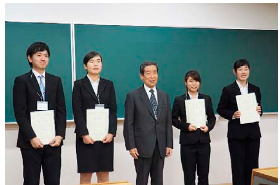
学生発表奨励賞の受賞者