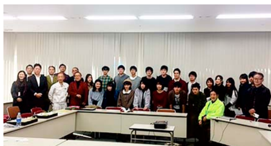
写真2 学生と団体会員

広島では貴重なインテリア分野のイベントとして始まったこのイベントが、インテリア業界と学生の交流を深め、さらに充実した内容で盛り上がっていくことを願いたい。