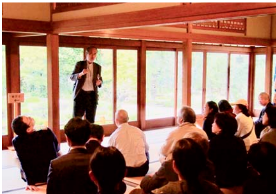
建具の細工説明の様子