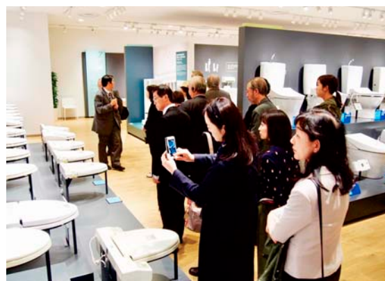
ウォシュレットの展示